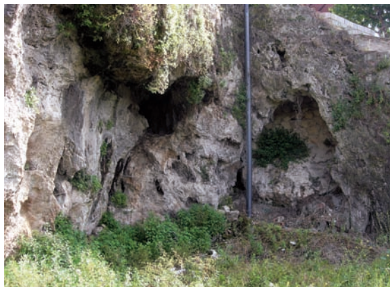
Vistas del entorno y cueva mayor tabicada, en la que puede apreciarse el pequeño saliente rocoso en una de las jambas del arco y que recuerda la tendencia a cerrarse en herradura existente en algunas de las cuevas del conjunto monástico principal.