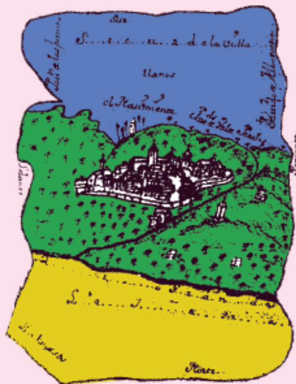
EL MAPA DE LA VILLA DE COÍN EN EL CATAS-TRO DEL MARQUÉS DE LA ENSENADA. 1752

© Edición : José Manuel García Agüera FUNDACIÓN GARCÍA AGÜERA