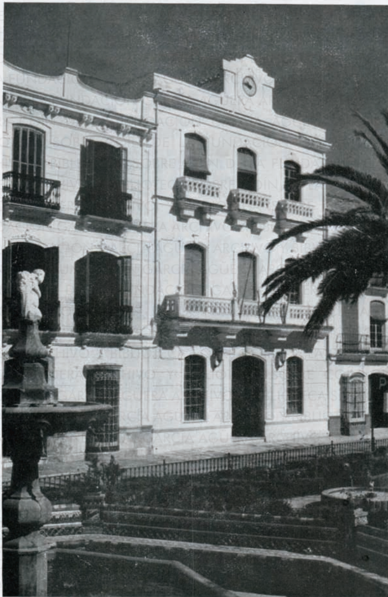
Estáis contemplando la fachada del Excelentísimo Ayuntamiento coineño, que se encuentra situado en la Alameda del Gral. Aranda, más conocida por la Alameda