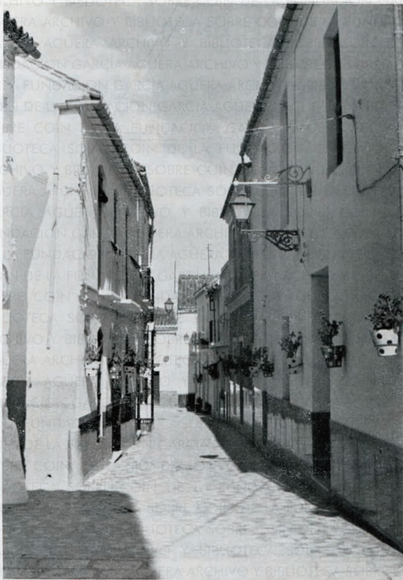
En Coín hay muchos rincones con acentuado tipismo, uno de ellos, es la calle Doce de Febrero, más conocida con el sobrenombre de calle «Cachito», debido a que su suelo está pavimentado con trozos de mármol de distintas tonalidades que con sus macetas y faroles, hacen de este pasaje, un lugar bello y sereno