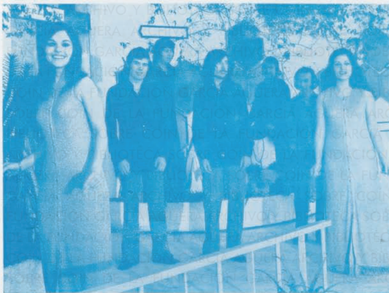
7 Nosotras y ellos