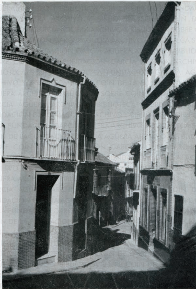
COÍN, ciudad moruna, aún conserva en sus calles, el hechizo de aquella época que le dominó. Obsérvelo contemplando esta vista de la calle Santa María