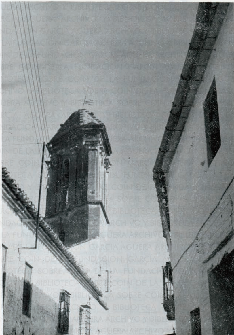
En esta fotografía, podemos apreciar la belleza y elegancia de esta torre triangular, perteneciente a un antiguo convento franciscano, hoy destruido